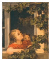
G. F. Kersting: Kinder am offenen Fenster

Das Museum der Barlachstadt Güstrow, gegründet im Jahre 1892, zählt heute zu den bedeutenden kulturhistorischen Museen des Landes Mecklenburg-Vorpommern. Auf 500 m 2 Ausstellungsfläche dokumentiert es die Geschichte, Kunst und Kultur der Barlachstadt Güstrow. Großaufnahmen historischer Bildvorlagen und computergestützte Medien verstärken den visuellen Eindruck der Ausstellung.